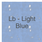
Lb - Light Blue

NOTA INFORMATIVA - La composizione dei tessuti, i colori ed il peso potrebbero variare rispetto a quanto indicato sul Sito Burger-print.com . Per ulteriori informazioni visita l'apposita sezione delle Condizioni di Vendita - Scelta del prodotto e modalità d'acquisto - e il sito del produttore Russell .