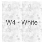
W4 - White